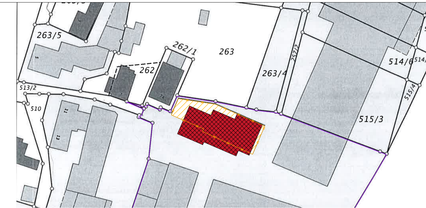
Lageplanauszug M 1:1000